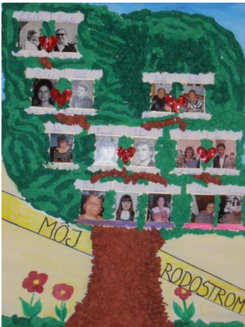
Rodostrom- Samantha Síthová 2. B