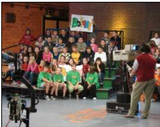
Vyhrali sme v STV