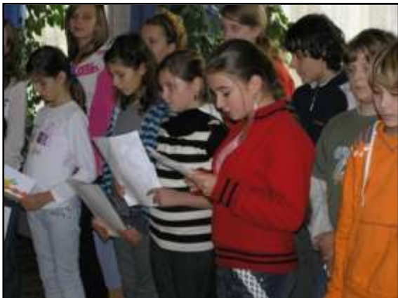
Návšteva v penzióne