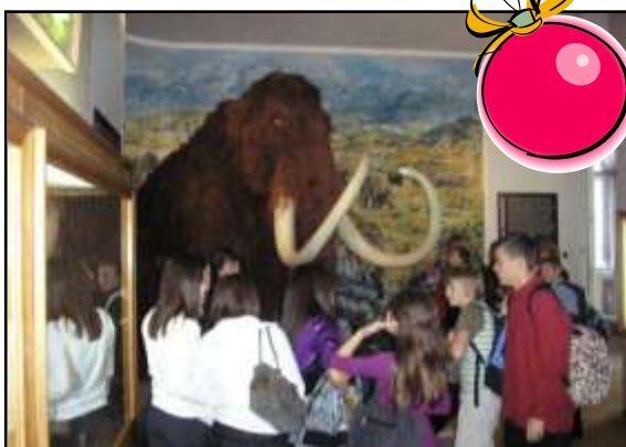
Exkurzia v Bratislave