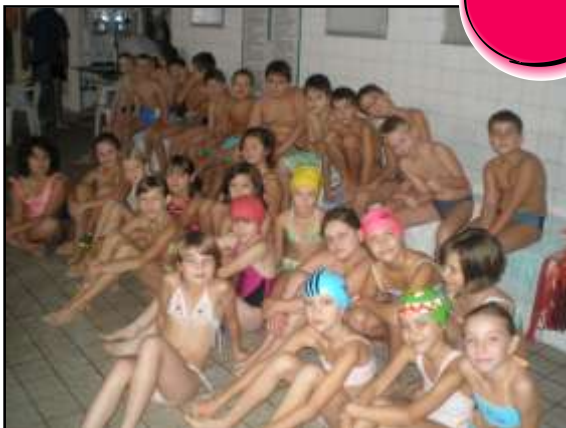
Učili sme sa plávať