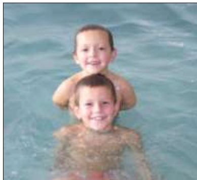
Pozrite, ako pekne plávame