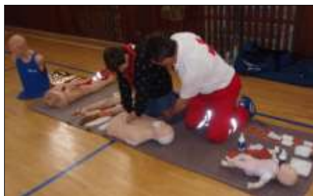
Takto treba správne dávať prvú pomoc